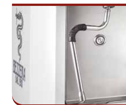
Cool touch steam Wand