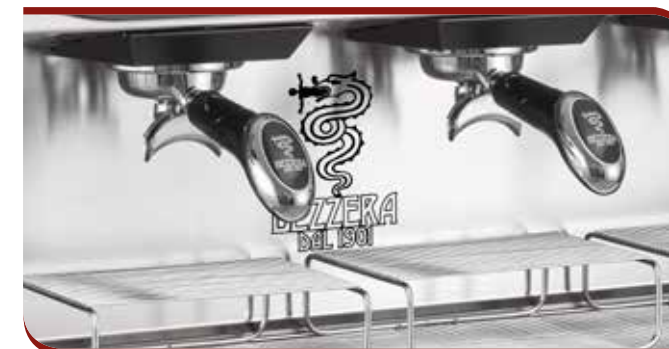
Tall cup friendly working area

The wide working area and the unique trays allow to use cups up to 14cm high, in addition to the traditional espresso coffee cups. All ARCADIA models are equipped with internal volumetric motor-pump inside the machine directly connected to the water mains.